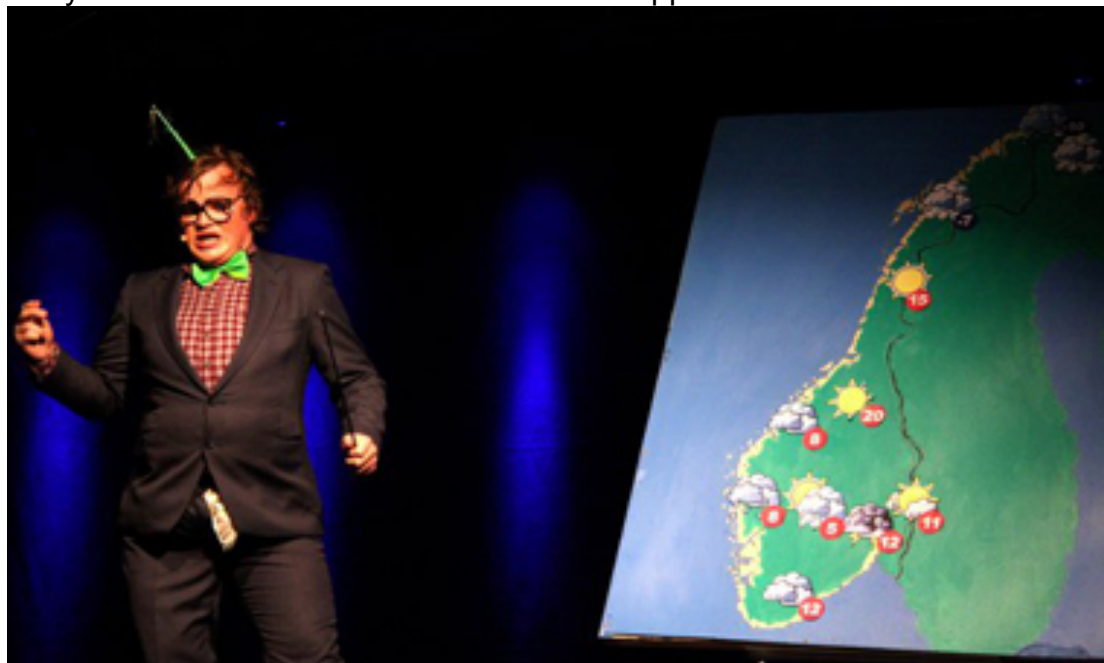
"Beste revynummer" - Norsk Revyfestival 2011: "Værmeldingen"

Revyen "Helt likt - bare annerledes" ble satt opp i februar 2010.